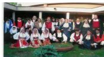
Gruppo Folk "ICHNOS"

Sabato 7 Giugno - Ore 18,30 Apertura del Ristorante Tipico Sardo