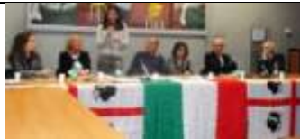
MONZA - OMAGGIO A GRAZIA DELEDDA A CENTO ANNI DAL LIBRO "CANNE AL VENTO"

1- MONZA 28 OTTOBRE 2012 - INIZIO PROGETTO SU GRAZIA DELEDDA UN PREMIO NOBEL DALLA SARDEGNA ALLA LOMBARDIA - CONFERENZA CON ASSESSORI ALLA ISTRUZIONE E CULTURA DELLA PROVINCIA DI MONZA E BRIANZA E DEL COMUNE DI MONZA CON STUDIOSI DI GRAZIA DELEDDA - E PARLAMENTARI DELLA BRIANZA GRANDE SUCCESSO DI PARTECIPAZIONE E PER IL GRANDE RICORDO DI GRAZIA DELEDDA, CON PROPOSTA DI PRESENTARE IN COMMISSIONE CULTURA DELLA CAMERA, UNA RISOLUZIONE PER FAR CONOSCERE LA FIGURA E LE OPERE DI GRAZIA DELEDDA, IN TUTTE LE SCUOLE, NEL CENTENARIO DELLA SUA PODEROSA OPERA CANNE AL VENTO CON CUI VINSE IL PREMIO NOBEL PER LA LETTERATURA 1926. UNICA DONNA ITALIANA AD AVER RICEVUTO LA PRESIGIOSA ONORIFICENZA.