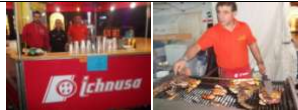
BIRRERIA - GRIGLIERIA-SEADAS-PANINI SARDI