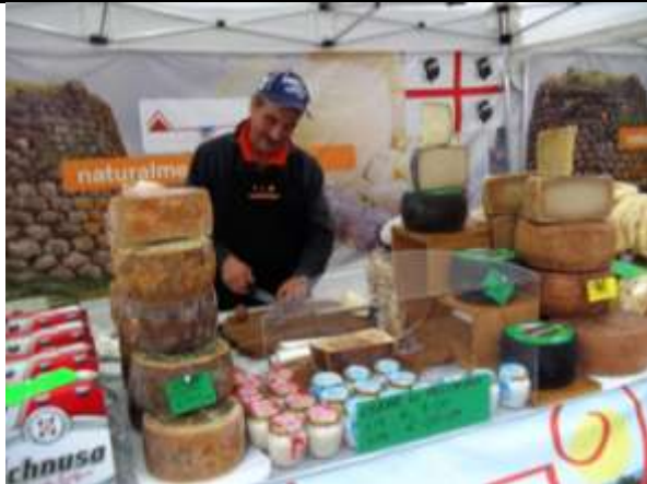
PRODOTTI SARDI - ENOGASTRONOMIA

IN PIAZZA MARCONI DALLE ORE 9 ALLE ORE 22 -- UNA FIERA MERCATO TUTTA DA SCOPRIRE!