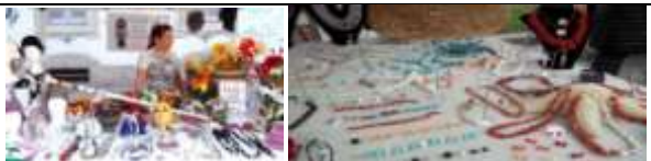
ARTIGIANATO DELLA SARDEGNA