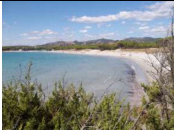
TURISMO E VACANZE IN SARDEGNA

VOLO DA LINATE 55 €. www.sardegnaturismo.com