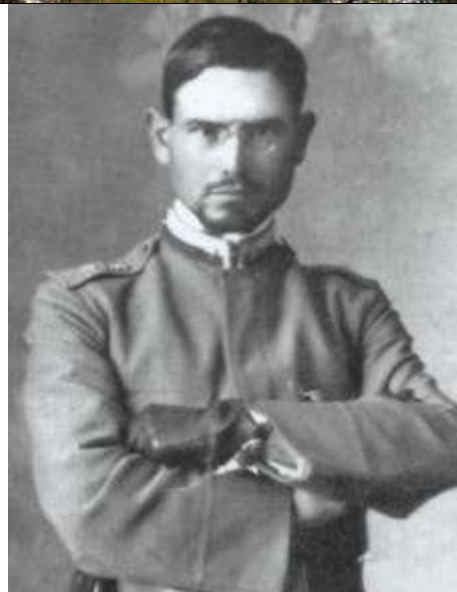
EMILIO LUSSU E LA GRANDE GUERRA 1915-1918 CON LA BRIGATA SASSARI SULLE MONTAGNE DEL CARSO