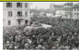
4 NOVEMBRE 1918 VITTORIA ITALIANA E FINE DELLA GUERRA