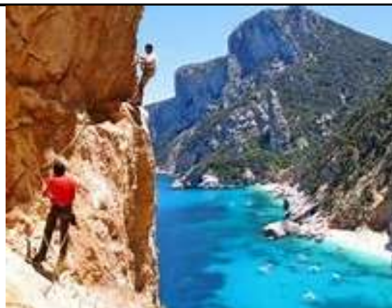
SUPRAMONTE DI BAUNEI-NUORO-SARDEGNA