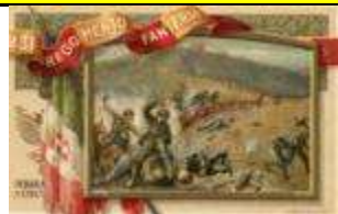
600 MILA MORTI PER CONQUISTARE 15 KM DI MONTAGNA

SABATO 10 MARZO 2018 - ORE 16 LA MOSTRA "LA MONTAGNA TRA PAESAGGIO E MUSICA" SARA' INAUGURATA AL CENTRO CIVICO LIBERTHUB - A MONZA IN VIA LIBERTA' 144 - CON CANTI E POESIE DELLA TRADIZIONE MONTANARA E ALPINA E DELLA GRANDE GUERRA PER IL CENTENARIO DELLA VITTORIA - 1915- 1918 IN OMAGGIO A EMILIO LUSSU - SOLDATO E AUTORE DEL LIBRO UN ANNO SULL'ALTIPIANO