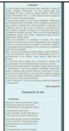
L LIBRO DI OFELIA USAI FRAMMENTI DI VITA