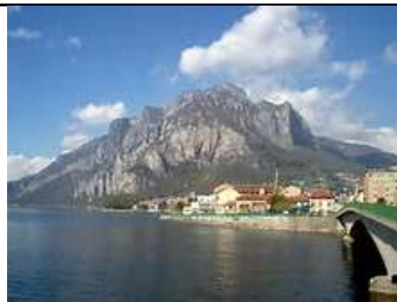
LOMBARDIA - LA GRIGNA DI LECCO-