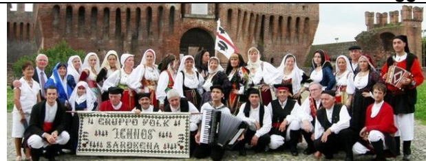
BALLI CON GRUPPI FOLK DI SARDEGNA E BRIANZA

Visitate la mostra in Villa Zoia dal 19 al 26 Maggio